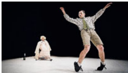
Una scena da "Beast without Beauty".

Annullato per motivi di salute, invece, il concerto di Giorgio Poi , previsto per stasera all' Hiroshima . La data verrà recuperata il 24 novembre.