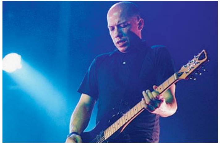
Il chitarrista dei Mogwai salirà sul palco questa sera.

MUSICA Due giorni fra rock alternativo e canzone d'autore allo Spazio211. Si parte stasera (ore 21.30, euro 20) con un nome di culto come Stuart Braithwaite , leader, cantante e chitarrista degli scozzesi Mogwai, band di riferimento della scena post-rock internazionale. All'inizio del nuovo millennio, durante le pause dell'attività col gruppo, Stuart ha incominciato anche a suonare in proprio: una dimensione solitaria e minimale, ma non per questo priva di energia e vigore. Il suo sarà un concerto intimo e rumoroso al tempo stesso: voce, chitarra e pedaliera, spaziando fra pezzi inediti e classici dei Mogwai. A seguire, domani (ore 21.30, euro 10), l'apertura del nuovo tour del cantautore Nicolò Carnesi , che presenterà l'album "Ho bisogno di dirti domani", una riflessione sul